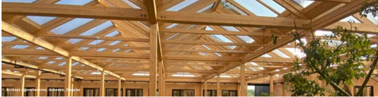
Koncept Agorahaverne, Ibihaven, Slagelse