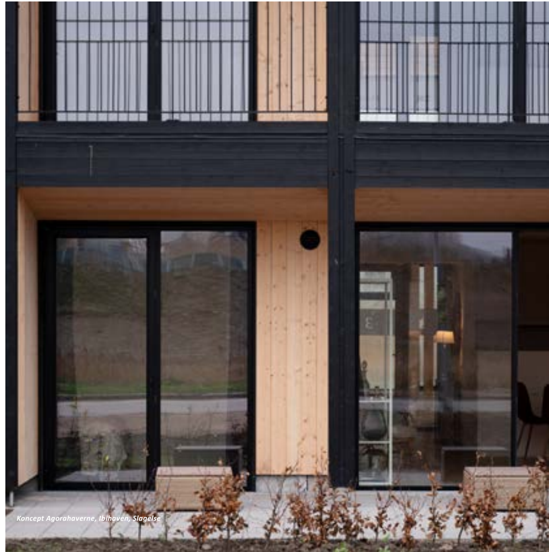
Koncept Agorahaverne, Ibihaven, Slagelse

I vores kultur er det vigtigt, at alle oplæres i at bringe egne kompetencer i spil, og tage ejerskab både over egne ansvarsområder og det fælles projekt.