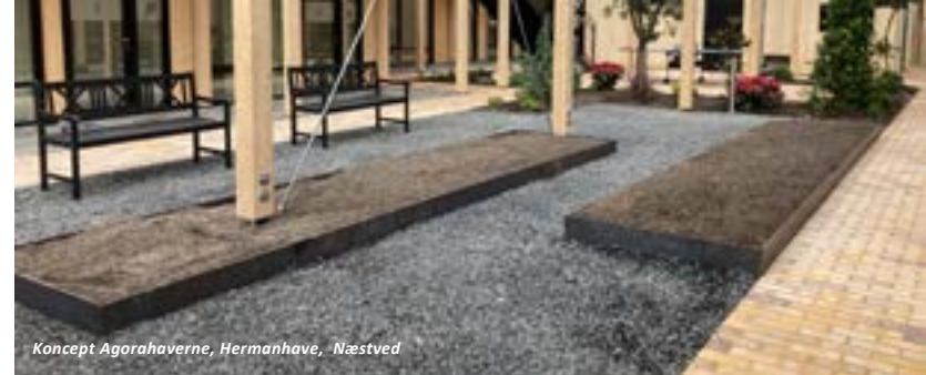
Koncept Agorahaverne, Hermanhave, Næstved

Det er vigtigt for os at mindske vores CO2 udslip og udføre bæredygtige byggerier. Alle vores konceptbyggerier kan certificeres til DGNB Guld eller Svanemærkes.