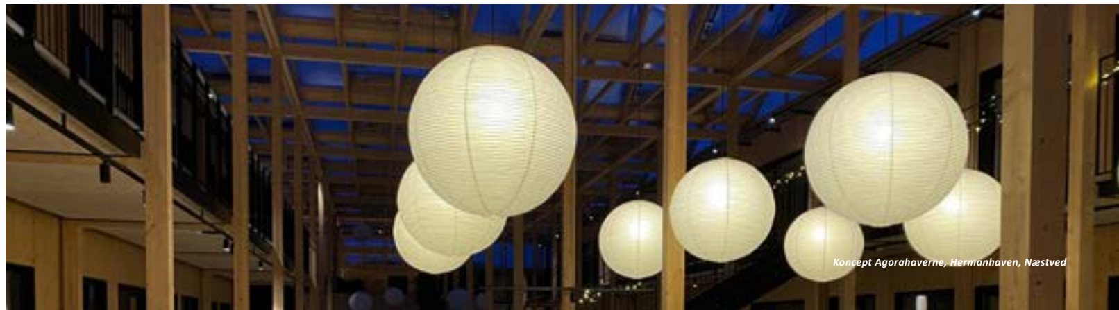
Koncept Agorahaverne, Hermanhaven, Næstved

Vi arbejder hårdt på at udføre vores byggerier i god håndværksmæssig kvalitet og vælger løsninger der tilgodeser lave driftsomkostninger og simpel vedligeholdelse.